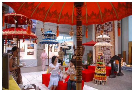
昨年の 第1回 リトル インドネシア・イン・ジャパン2008開催風景